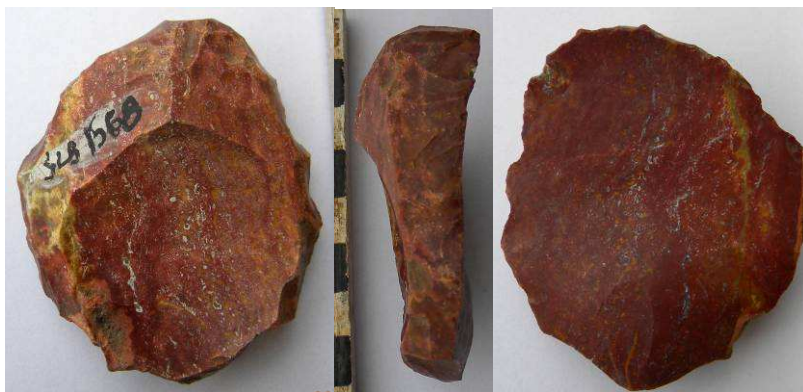
Fig. 4 : Outil double, grattoir et denticulé