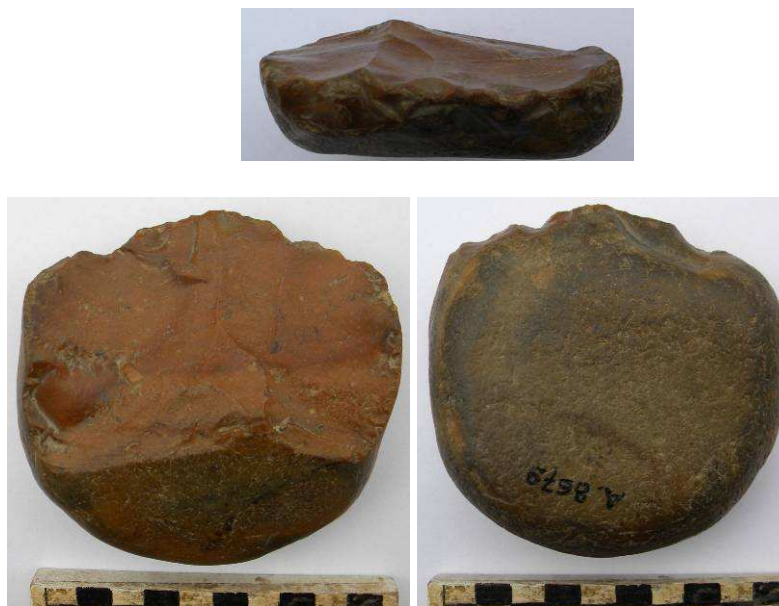
Fig. 2: Galet en silex exploitée sommaires